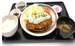
びっくりチキンカツ定食