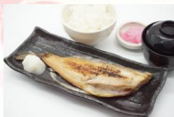
塩さば炙り焼き定食