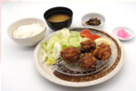
自家製唐揚げ定食